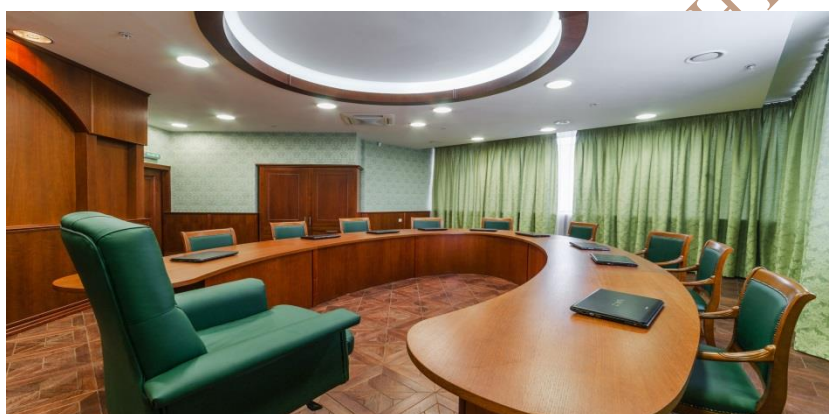
Аудитория для проведения семинарских занятий по теоретическим дисциплинам